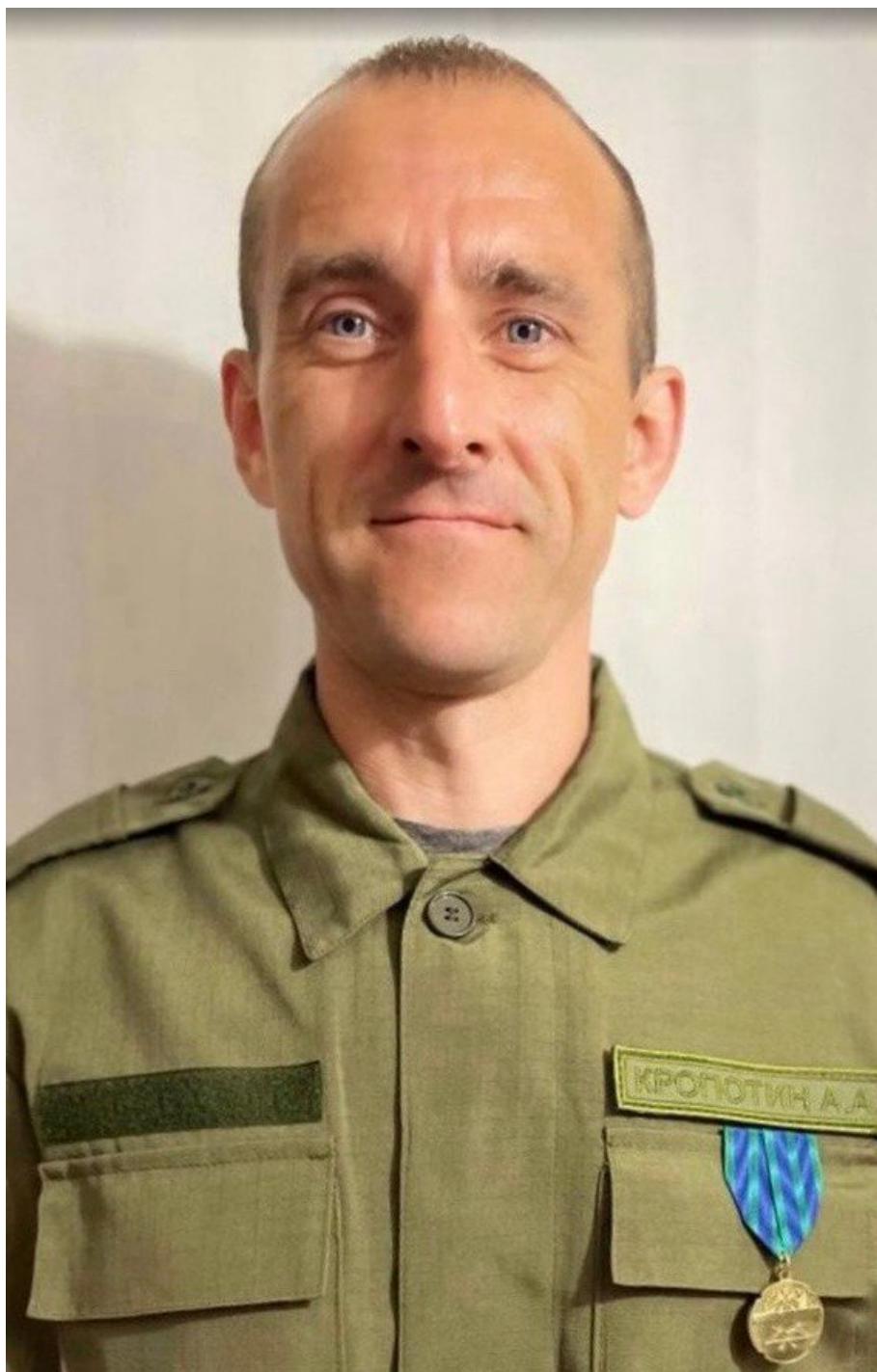
Автоэксперт. Индивидуальный предприниматель. Член Общественной наблюдательной комиссии VII созыва.