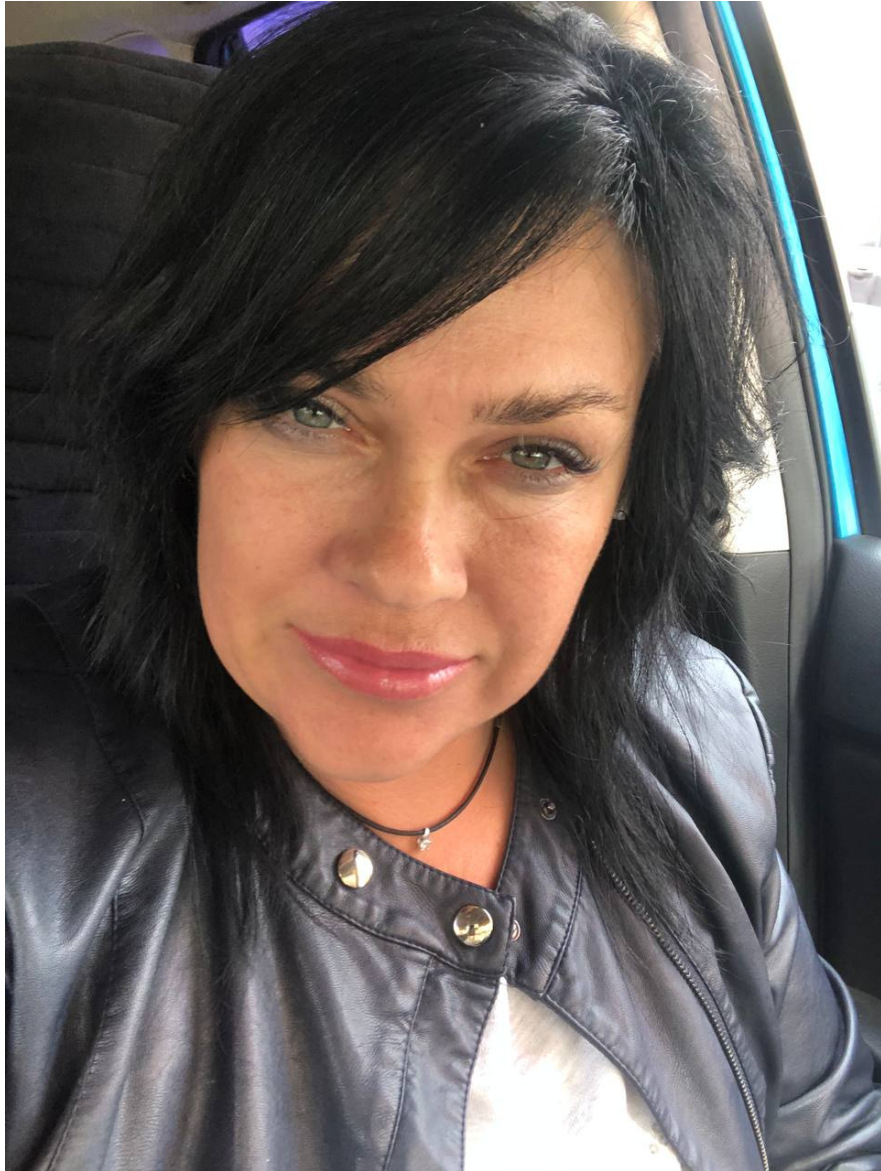
Партнер Благотворительного Фонда «Источник Надежды». Социальный работник. Член Общественной наблюдательной комиссии VII созыва.