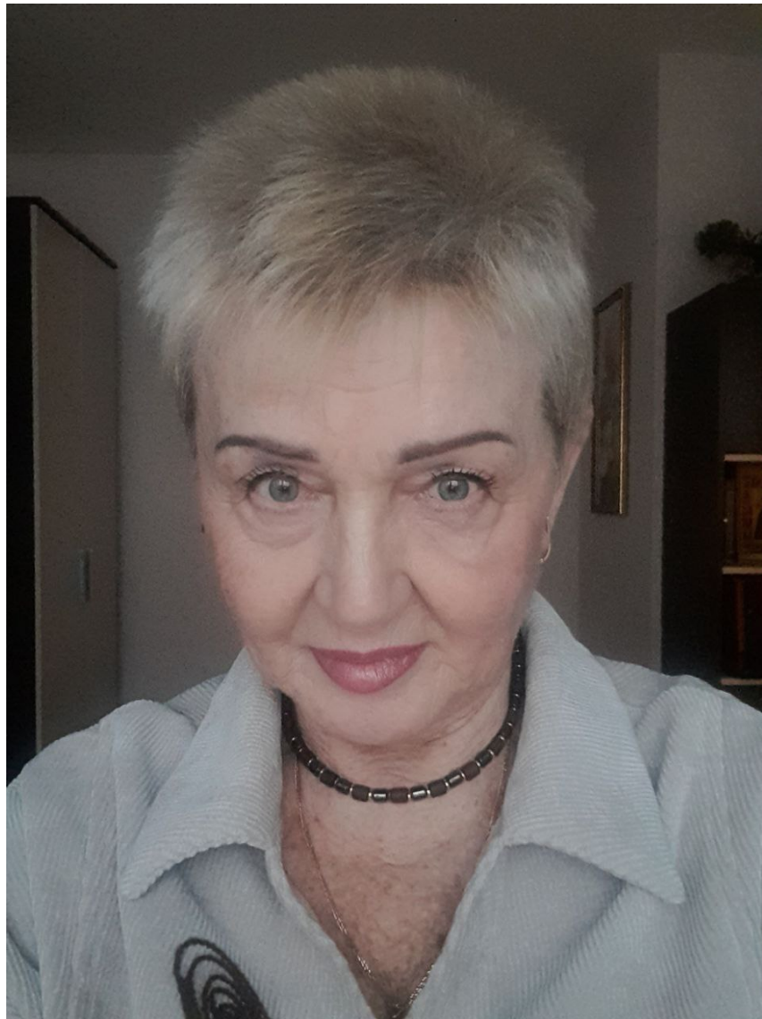
Член Общественной наблюдательной комиссии VII созыва. Специалист ювелирной мастерской «Золотой мастер».