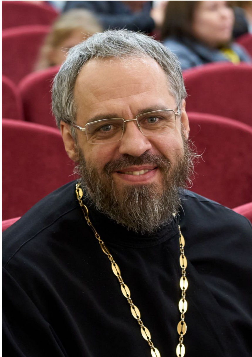
Священнослужитель Одигитриевского женского монастыря. Член Общественной наблюдательной комиссии ВШсозыва.